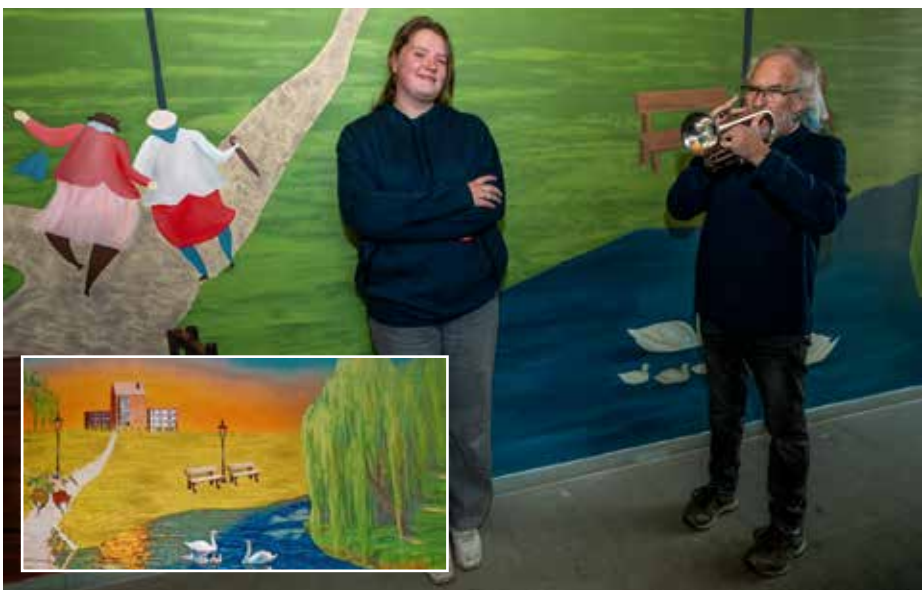
Op 30 januari werd in Het Hoge Huis het CIBAP-kunstwerk feestelijk onthuld