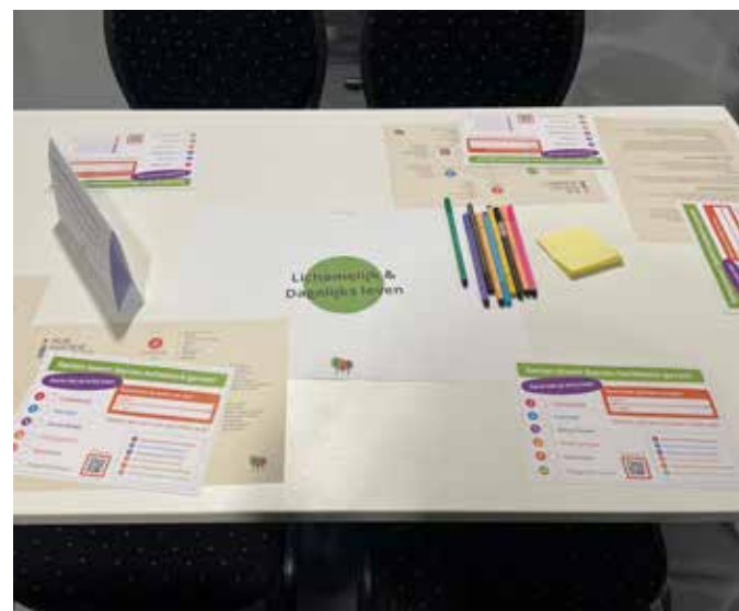
Het onderwerp positieve Gezondheid werd in groepjes verkend en uitgediept