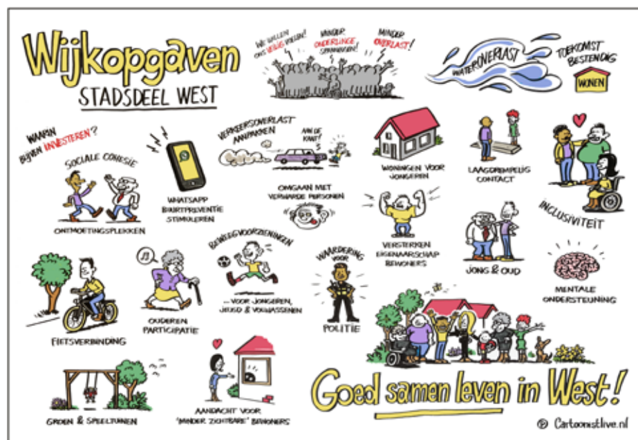
De wijkopgaven voor Stadshagen, samengevat in een cartoon

Wil je met het Wijkteam in contact komen? Loop binnen bij het wijkservicepunt in het Cultuurhuis (Werkerlaan 1) of volg ons op Instagram; wspzwollewest