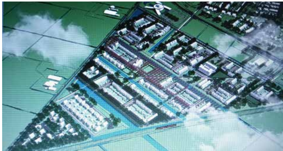
In buurt Broeks komen 650 woningen voor diverse doelgroepen

Het is de verwachting dat de woningbouw in 2027 van start kan gaan. De verkoop van de woningen zal eerder starten, naar verwachting in de loop van 2026. Voor wat betreft de uitvoering van de werkzaamheden voor de verbreding van de Scholtensteeg, het vrijliggend fietspad en de rotonde is de planning op dit moment nog niet bekend.