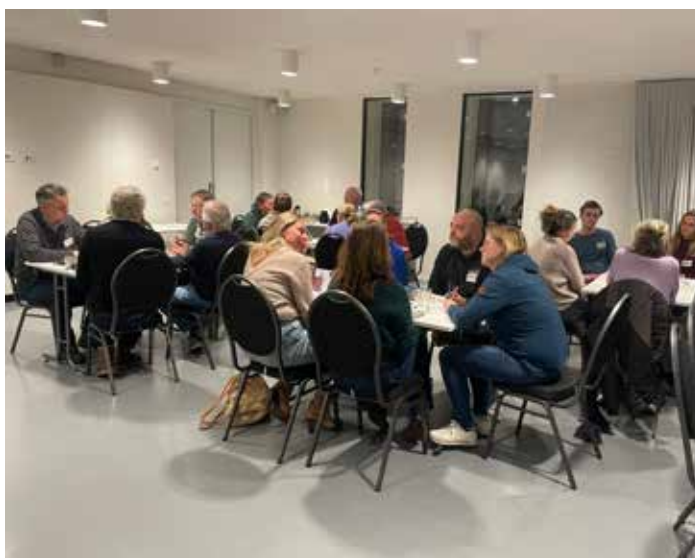
Tijdens het wijkcafé werd nagedacht over wat de wijk nodig heeft en welke kansen er liggen

Inleverdatum maart 2026: uiterlijk 20 februari 2026