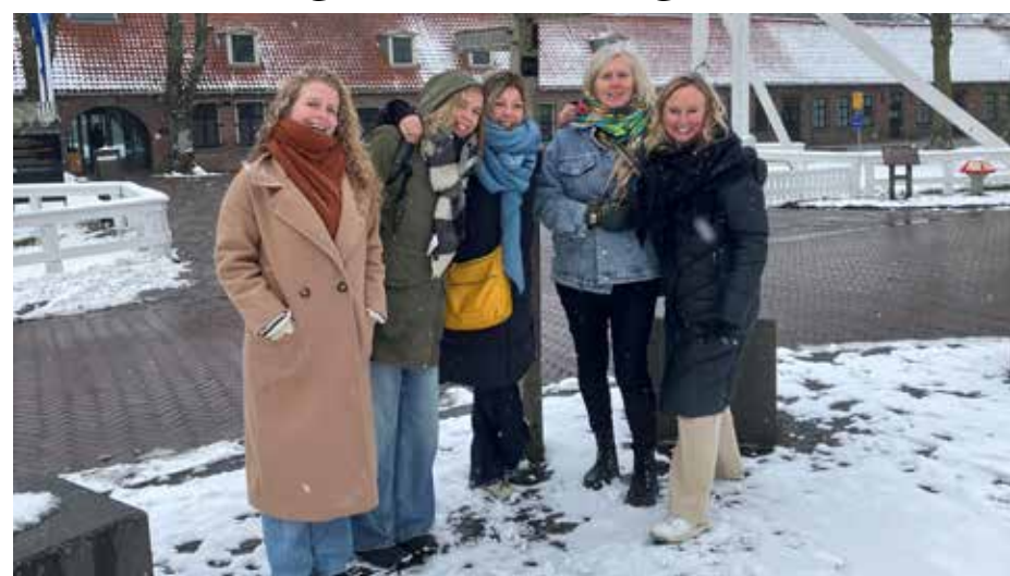
Het Wijkservicepunt in Stadshagen is weer op sterkte