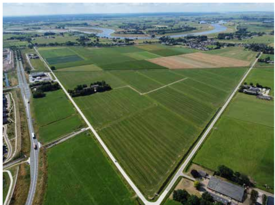
Het gebied Breecamp-West met bovenin de foto 's Heerenbroek, links de Scholtensteeg; de horizontale lijn is de spoorlijn Stadshagen-Kampen