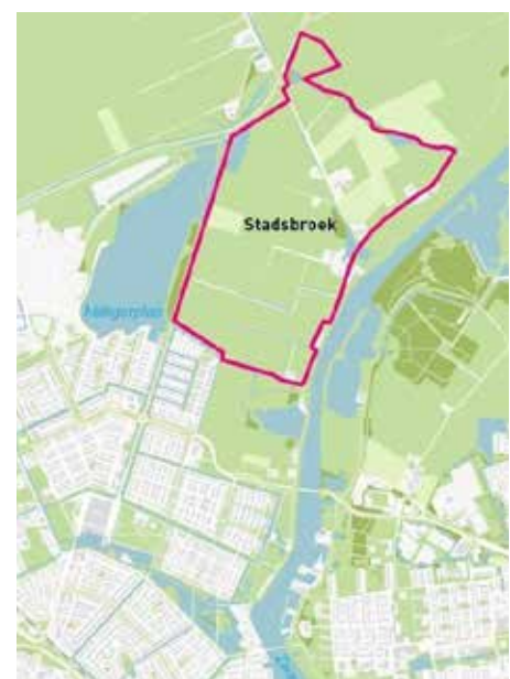
De ligging van Stadsbroek aan de noordkant van Stadshagen met links op de foto de Milligerplas

Wil je met ons meedenken, heb je ideeën, wil je een keer aansluiten bij een bestuursvergadering of wil je gewoon meer informatie? Neem dan een kijkje op: www.stadshagentotaal.nl .