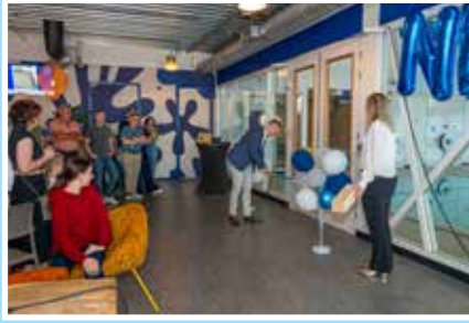
03 Zwemschool Nemo geopend