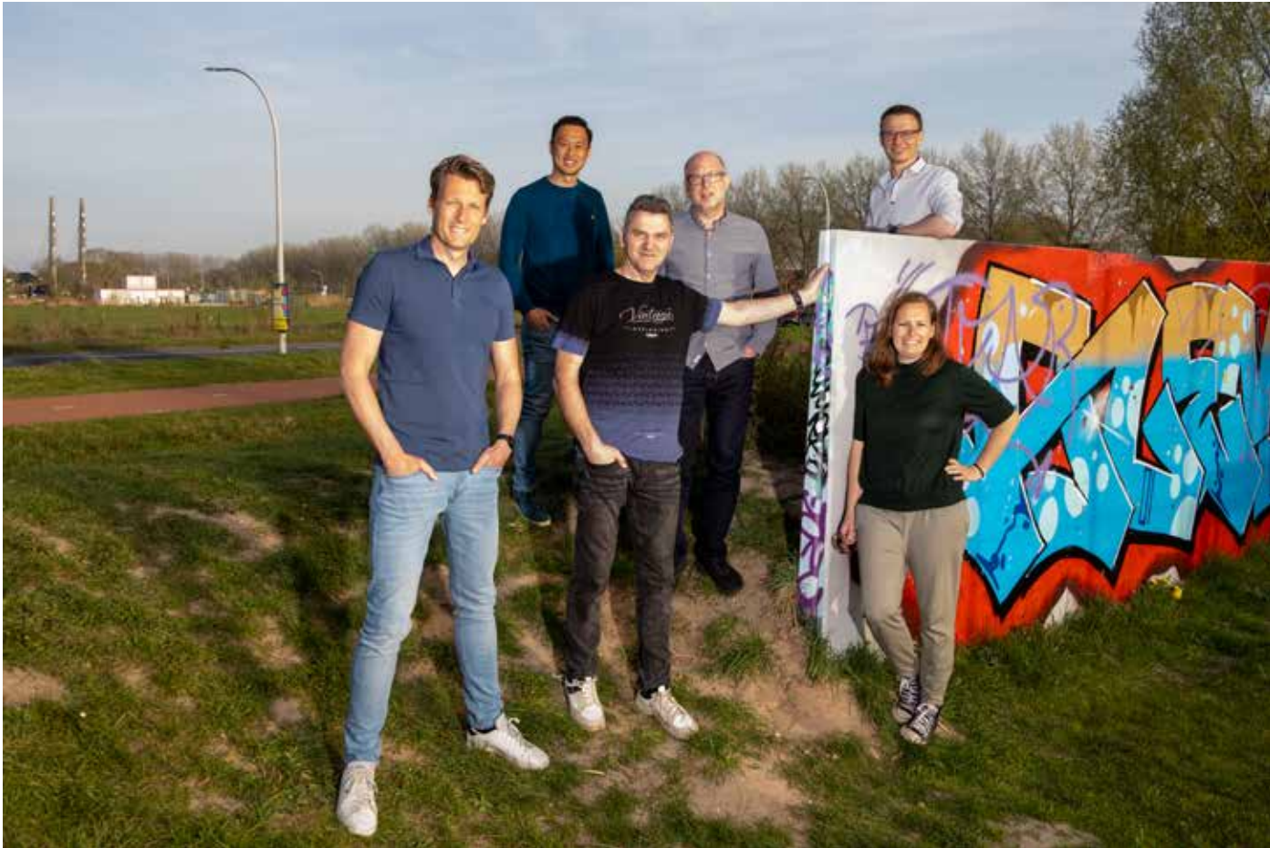
Het bestuur zet zich met zes vrijwilligers in voor de belangen van de inwoners van Stadshagen