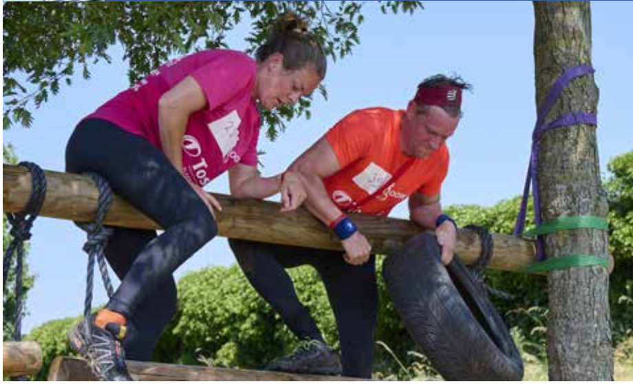
De OO Survivalrun is meer dan alleen een sportwedstrijd