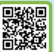
Scan de QRcode

Dan is samenzwolle.nl/dementievriendelijk de plek om er alles over te vinden. Alle (Zwolle) initiatieven, organisaties en andere onderwerpen die met dementie te maken hebben, gebundeld op één pagina, Dementievriendelijke activiteiten en vrijwilligersvacatures vind je hier ook!