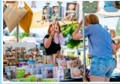
10 Voorzomermarkt Stadshoeve