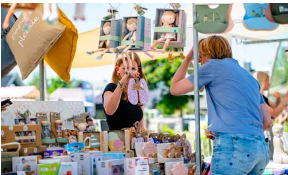
Park de Stadshoeve is op 24 mei weer omgetoverd tot een festijn van marktkramen, muziek, workshops en BBQ