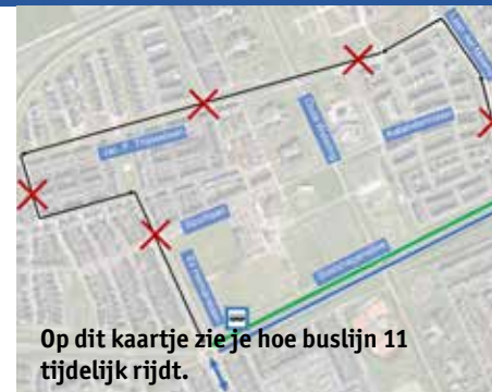
Op dit kaartje zie je hoe buslijn 11 tijdelijk rijdt.