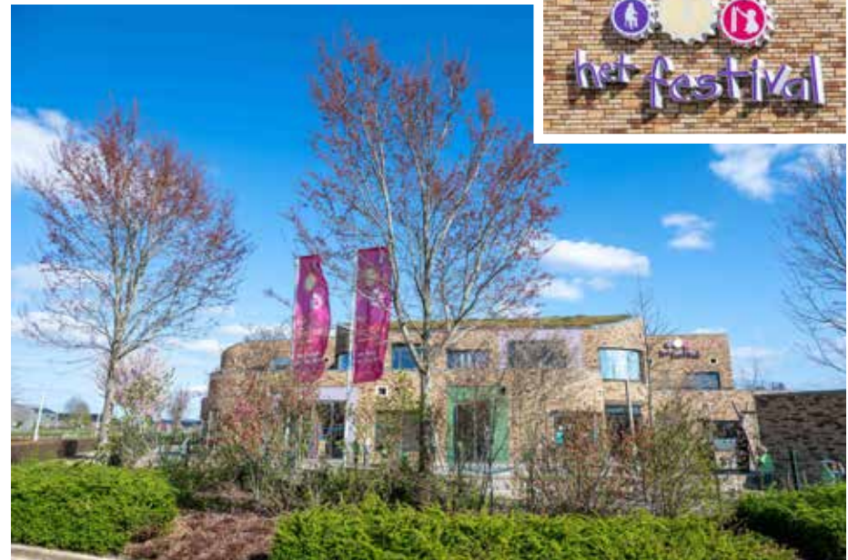
Met de komende uitbreiding is het capaciteitsprobleem van obs Het Festival opgelost

Het Festival de aanwezige capaciteit bij andere basisscholen worden benut. Door uitvoering van het genoemde schuifplan is een nieuw te bouwen school in De Tippe niet meer nodig,' concludeert het college van burgemeester en wethouders in zijn voorstellen aan de gemeenteraad, die hierover binnenkort een besluit zal nemen.