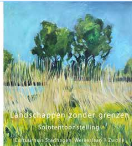
Landschappen zonder grenzen Solotentoonstelling Cultuurhuis Stadshagen, Werkerlaan 7 Zwolle