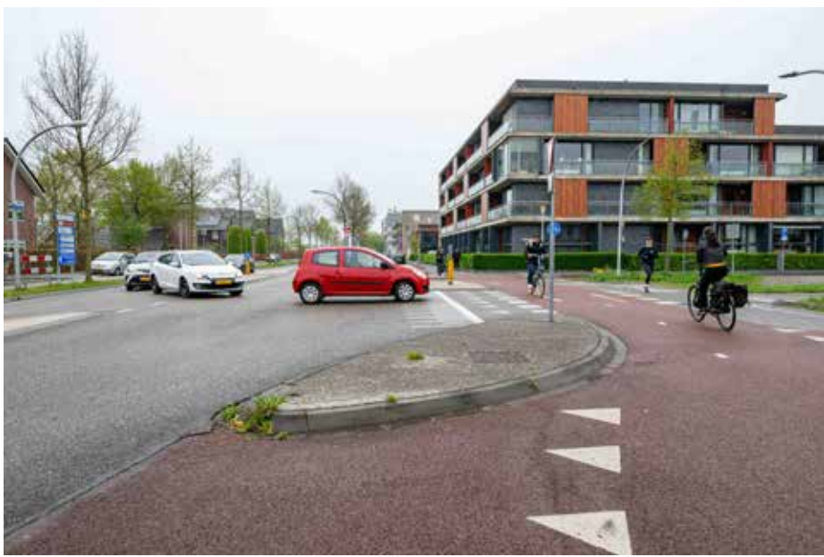
De druk bereden kruising Belvédèrelaan-Frankhuisweg vraagt om extra behoedzaamheid van automobilisten