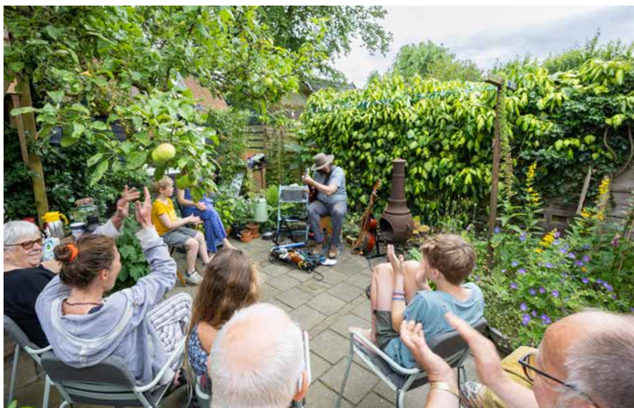
Uniek amateurfestival in de tuinen van Stadshagen