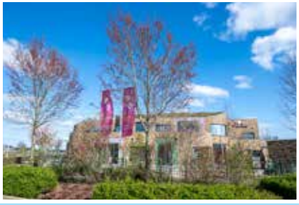
02 Het Festival breidt uit