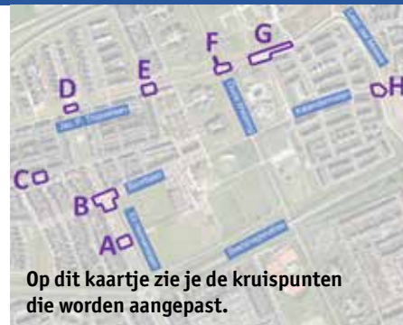
Op dit kaartje zie je de kruispunten die worden aangepast.

In de buurtschappen Reede en Kragge in Breezicht wordt volop gebouwd en gewoond. Zowel bewoners als bouwende partijen doen hun best om het wegwaaien van afval te voorkomen, maar toch komt het af en toe voor dat er zwerfafval in de omgeving ligt. Onlangs hebben de bewoners van Reede en Kragge daarom het initiatief genomen om een opruimactie te organiseren. Drie aannemers die actief zijn in Breezicht – Van Gelder Groep, Nikkels Bouwbedrijf en Schutte Bouw & Ontwikkeling – hebben ook hun steentje bijgedragen. Afgelopen maart gingen de aannemers gezamenlijk aan de slag om het gebied grondig op te ruimen. Dank aan de betrokken bewoners en aannemers voor hun inzet en samenwerking. Breezicht is weer een stukje schoner!