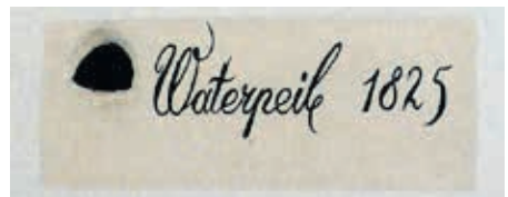
In het kerkje van Mastenbroek is op een plaquette aangegeven hoe hoog het water in 1825 is gekomen.

Van herdenken van de ramp uit 1825 is in de getroffen provincies in de afgelopen eeuwen nauwelijks sprake geweest. Zo raakte deze in de vergetelheid. De watersnoodramp in Zeeland van 1953 overschaduwde alles. Het herdenken van de 200 jaar geleden ramp is nu ineens terug. Op 5 februari jongstleden werd er een Watersnoodsymposium 1825 gehouden in Kampen; dit ter nagedachtenis aan de ramp en vooral ook om het bewustzijn over waterbeheer en de klimaatuitdagingen te vergroten. Het gevoel dat een dergelijke ramp opnieuw kan gebeuren is ineens weer actueel. 'Wie water eert, die water weert'. Er wordt de komende tijd gewerkt aan een zesdelige podcastserie over de ramp van 1825, te beluisteren op Spotify, Apple Podcasts en meer.