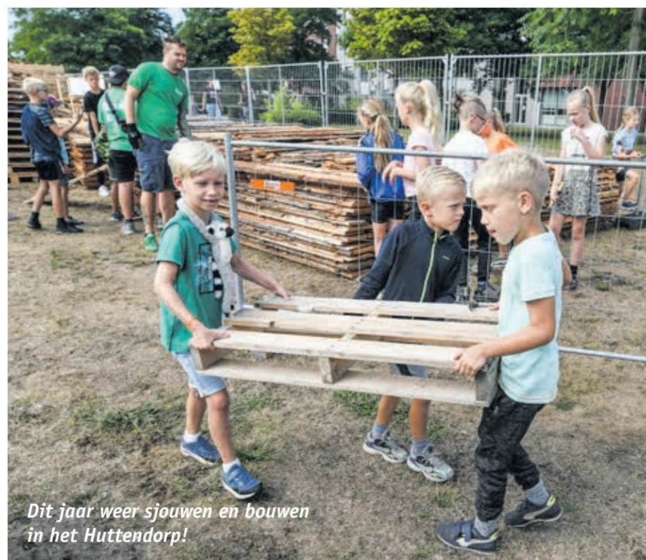
Dit jaar weer sjouwen en bouwen in het Huttendorp!

Benieuwd wat wij nog meer doen? Kijk op Stadshagentotaal.nl of volg ons via social media!