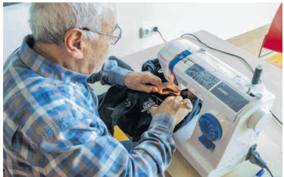
Kijken, knutselen, kotteren, klaar, knap!

Bezoek het Repair Café Stadshagen, elke laatste zaterdag van de maand 10.00 tot 14.00 uur, Cultuurhuis Stadshagen.