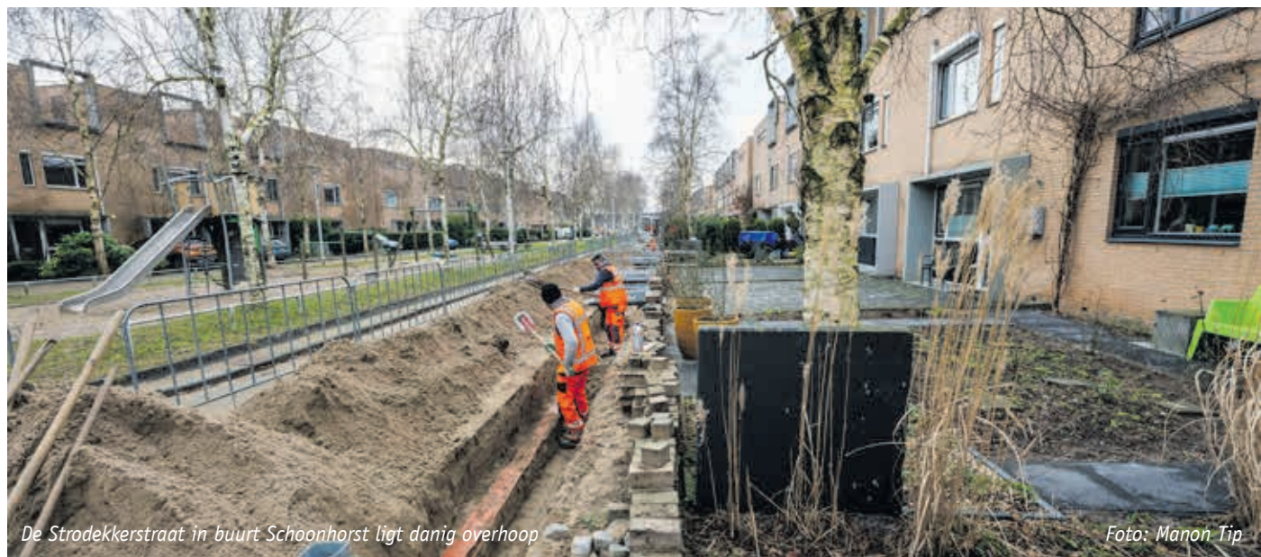
De Strodekkerstraat in buurt Schoonhorst ligt danig overhoop

(Toen deze krant naar de drukker ging, waren de uitkomsten van de raadsbehandeling van dit onderwerp op 4 maart nog niet bekend. Inmiddels zal de gemeenteraad een besluit over de Nota Parkeren hebben genomen.)