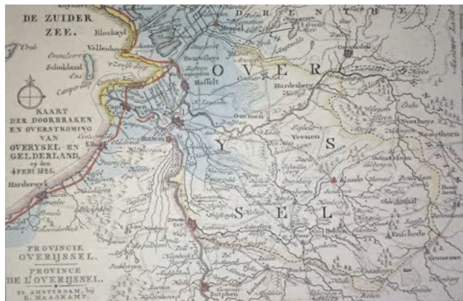
Historisch kaartje waarop is te zien hoe diep het water West-Overijssel en Friesland binnendrong.

Polder Mastenbroek kent sinds zijn drooglegging in de 14e eeuw een roerige geschiedenis. Hij was bij tijd en wijle het strijdtoneel van bisschoppen, boeren en rivaliserende kasteelheren. Het woelige water van de Zuiderzee eiste ook regelmatig zijn tol. De polder kent echter twee totaal verschillende gebeurtenissen die de grootste invloed op het bestaan van het gebied hebben gehad. Niet alleen de stormvloed in 1825, die hem veranderde in één grote watermassa. Ook de komst van inmiddels 10.000 woningen in Stadshagen heeft het karakter van het gebied ingrijpend veranderd.