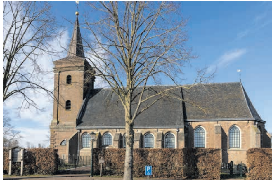
De kerk van Mastenbroek is het enige gebouw in de Polder Mastenbroek dat de ramp heeft overleefd.

De beperkte publieke en landelijke belangstelling voor deze ramp had alles te maken met de regionale, gedecentraliseerde aanpak. De ramp van 1825 gaf wel de stoot tot beter organiseren van het waterbeheer: voorgangers van de huidige