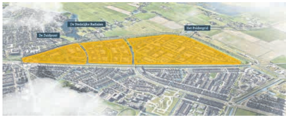
Buurtchappen in buurt de Tippe

Buurten De Tippe en Breezicht zijn momenteel in aanbouw. Stadsbroek en IJsselvier zijn studiegebieden, waar mogelijk een geringe hoeveelheid woningen gebouwd wordt. Brecamp-oost is een bestaande buurt, de driehoek westelijk hiervan, Brecamp-west, is het laatste te bebouwen gebied in onze wijk. We beperken ons deze keer tot de buurten waar momenteel wordt gebouwd: De Tippe, langs het spoor, en Breezicht, bij de Milligerplas.