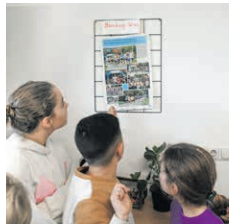
De kinderen laten met trots de fotopagina uit de Vinexpress zien, waar ook een groep leerlingen van de Kasteelhoeve op staat

De straatprijs is dit jaar naar de Labyrintstraat gegaan. Het bijbehorende naam bord is aan twee vertegenwoordigers van de straat overhandigd.