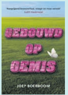
Joep Boerboom, schrijver van Gebouwd op Gemis

Een inspirerend verhaal over wat je samen kunt bereiken na een groot verlies