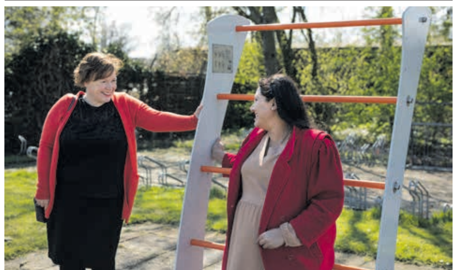
Vrijwilligers maken het verschil in gezinnen