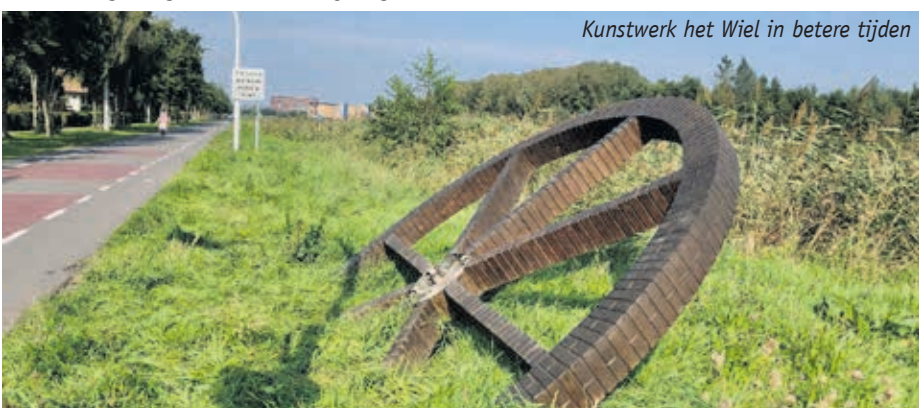
Kunstwerk het Wiel in betere tijden