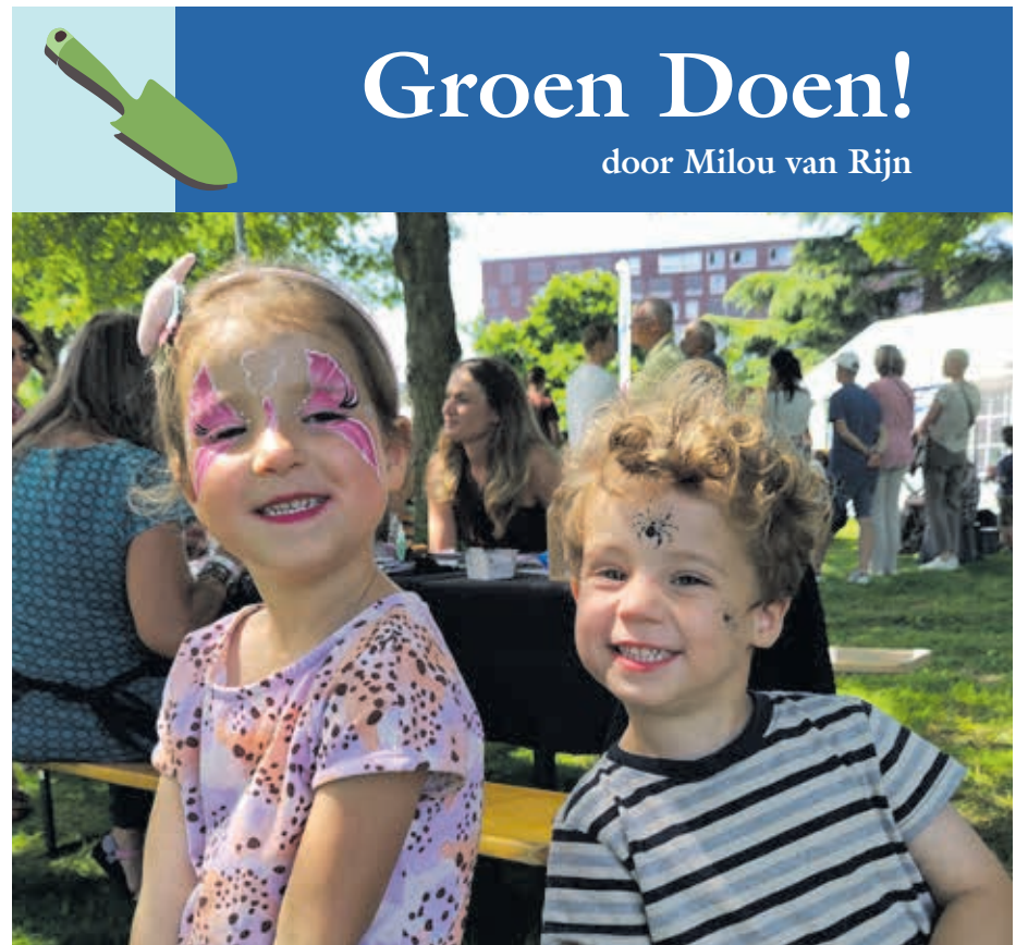
Activiteit Stadshagen doet Groen bij Symphonica Stadshagen Eigen foto Stadshagen doet Groen