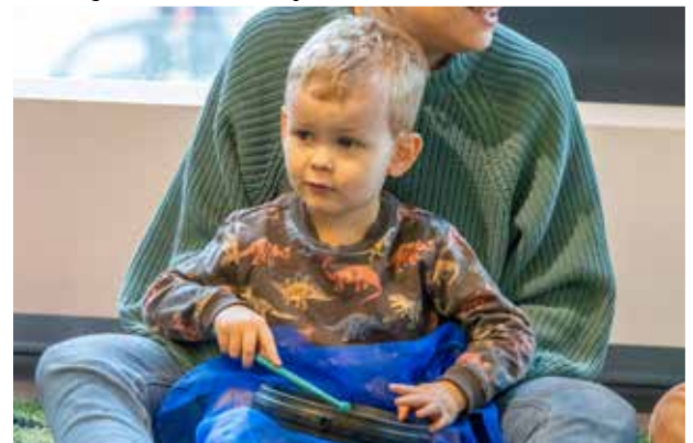
Ontdekken van je kleine motoriek