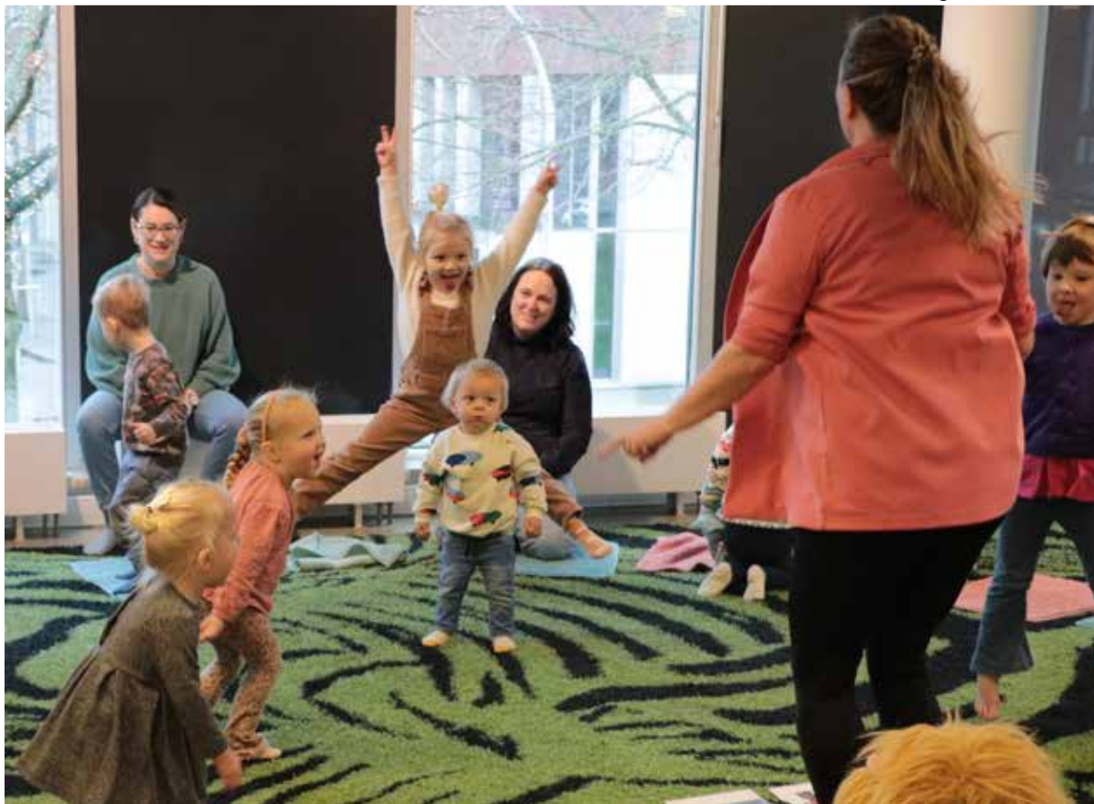
Alles geven in je dansje