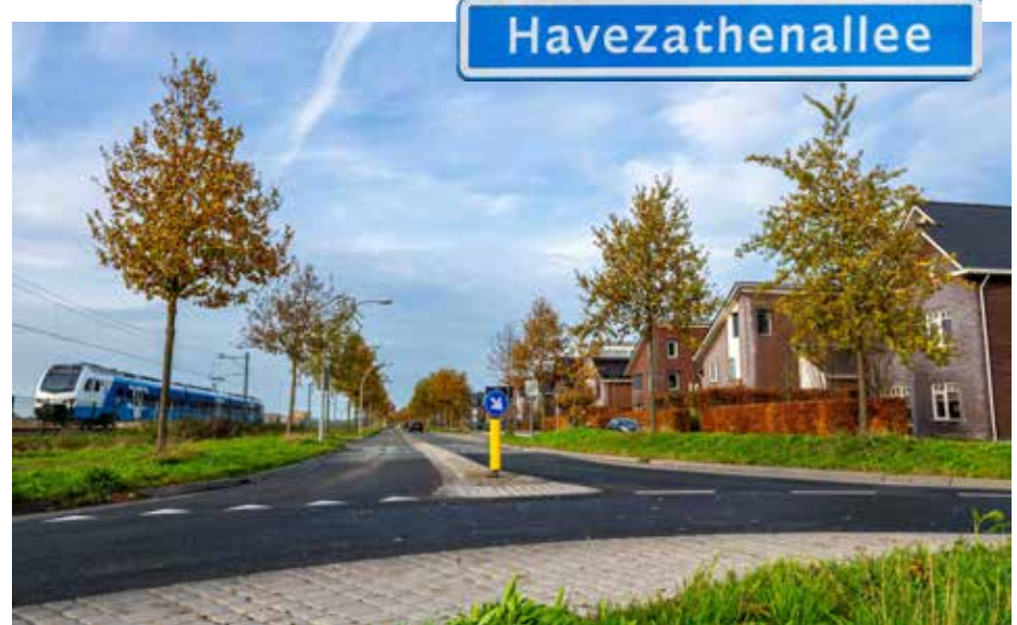
De Havezathenallee verbindt verschillende delen van Stadshagen met elkaar

Kortom, de Havezathenallee verbindt het historische karakter van de regio met het moderne leven in Stadshagen. Een unieke mix van verleden en toekomst! Bron: Wikipedia.