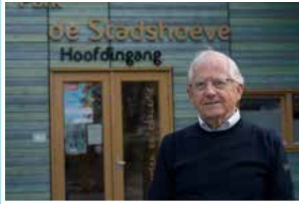
10 Positieve gezondheid