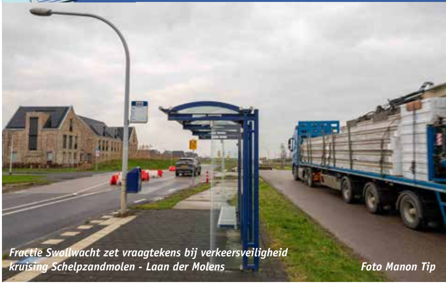
Fractie Swollwacht zet vraagtekens bij verkeersveiligheid kruising Schelpzandmolen - Laan der Molens