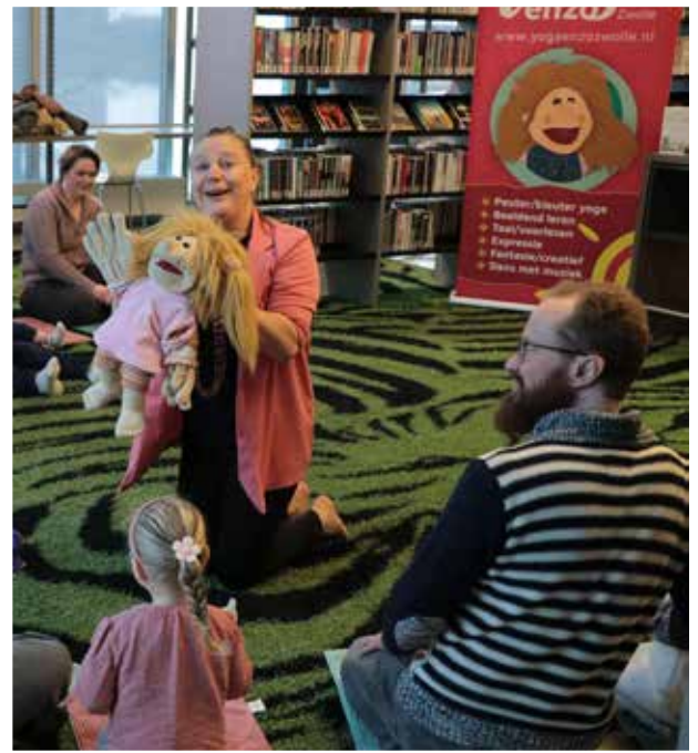
Peuter- en kleuteryoga in het Cultuurhuis