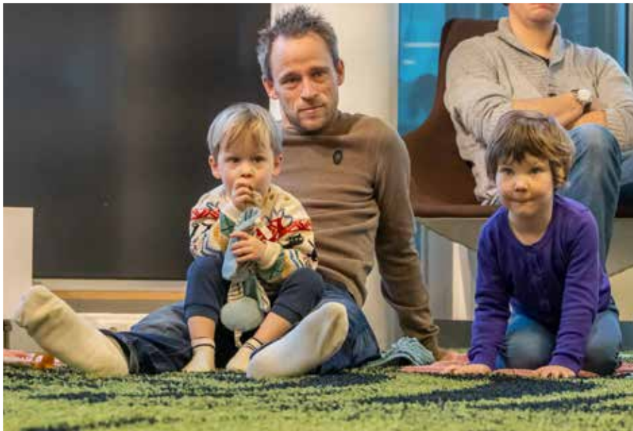
Ouders en kinderen luisteren aandachtig