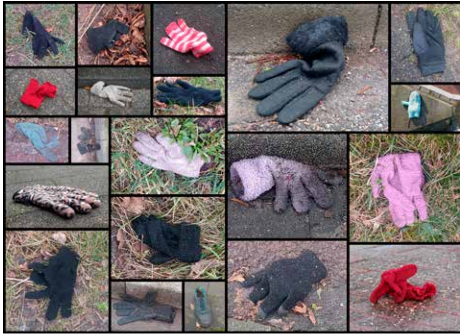
Een spoor van verloren handschoenen in de goten achtergelaten