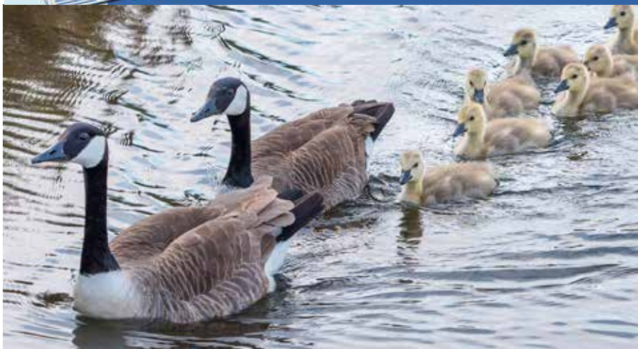
Geef de gans geen brood, anders gakt hij harder!