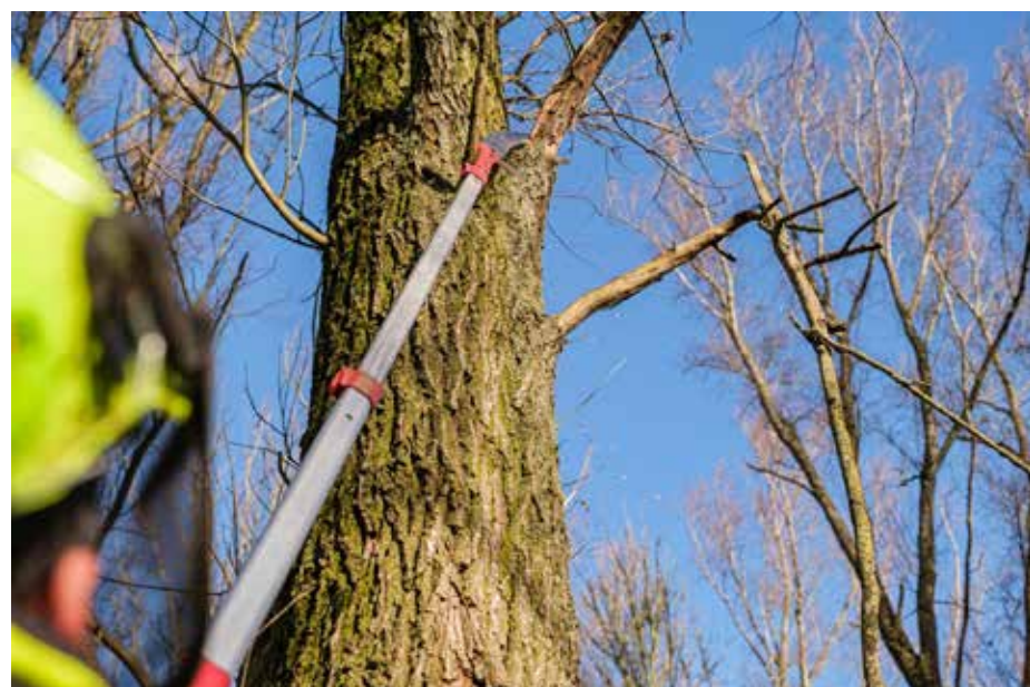
Voor iedere gekapte boom wordt een nieuwe geplaatst