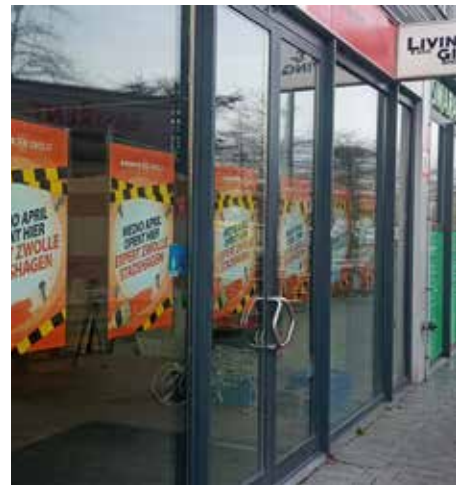
Expert groeit door naar de Werkerlaan