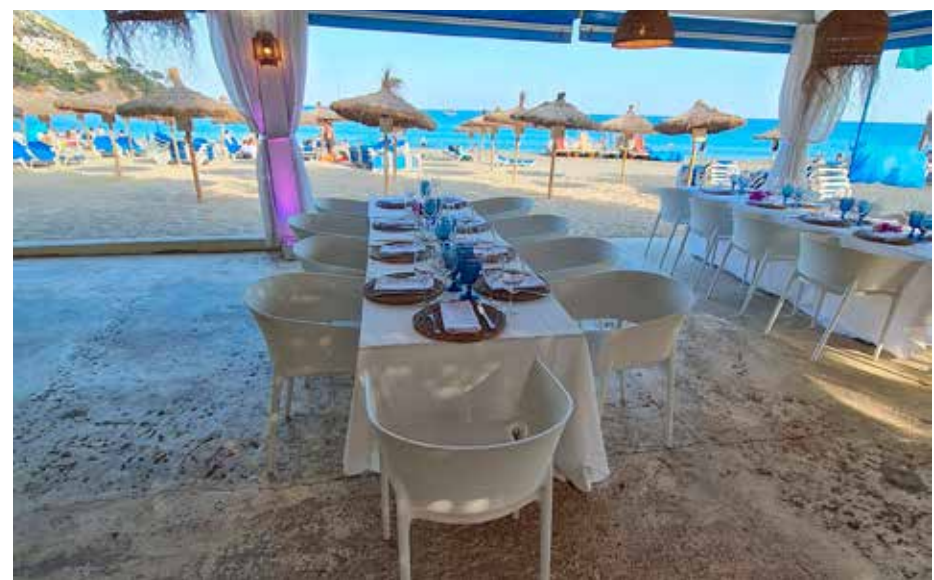
Een symbolische ceremonie kan op elke locatie worden gevierd

Heya! Mijn naam is Sabien Imming, ik ben 25 jaar oud en woon in Zwolle. In de zomer van 2022 ben ik afgestudeerd bij ArtEZ Zwolle als grafisch ontwerper