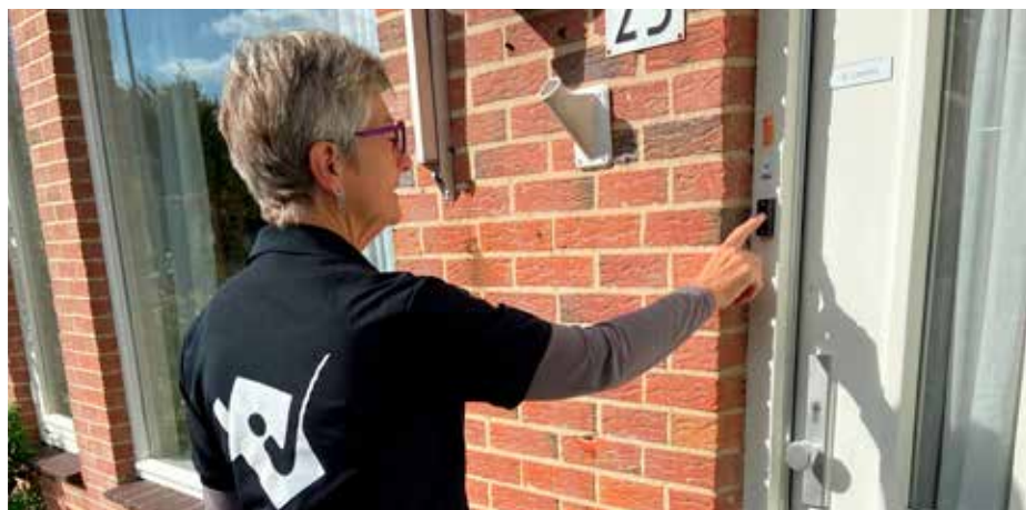
De planner komt op verzoek langs voor een afspraak

Bekijk voor meer informatie de video op www.vitaalenveiligthuis.nl om te zien hoe onze vrijwilligers zich inzetten voor het project. Of bel ons via telefoonnummer 038 - 851 57 00.