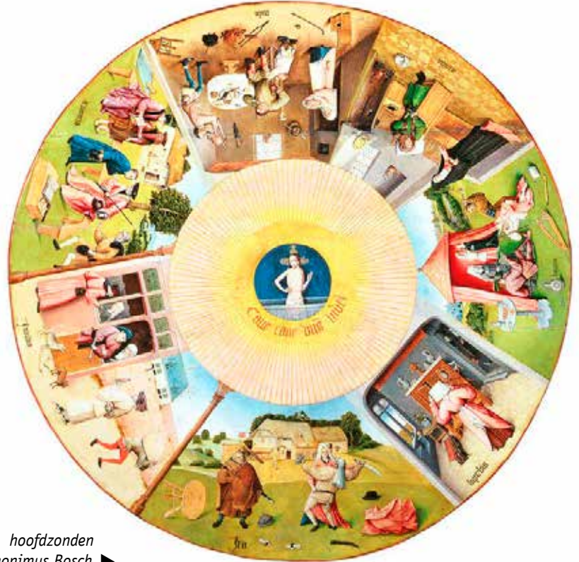
De zeven hoofdzonden van Jheronimus Bosch ►

voor dronken). Vier bevriende docenten gaan een 'drankexperiment' aan om hun duffe leven te kleuren. Echter, wij willen geen duf, maar een fantastisch Facebook-, Insta- en TikTok-waardig leven. Dan activeer je dopamine, dat stofje in onze hersenen dat een onmatig gevoel van geluk geeft. Verslaving is benzine voor dopamine. 'Waar heb ik zin in?' is onze levensvraag. Vaker, sneller, groter, beter, meer en makkelijk. Realiseerbaar dankzij onze vrijheid! Maar kunnen wij ongelimiteerde vrijheid wel aan? Gaan wij niet ten onder aan onmatigheid? Fastfoodindustrie zegt betuttelend dat we ons niet moeten laten betuttelen, en stopt ons vol met troep dat in de dierentuin niet geaccepteerd zou worden. Wakker Dier zou ons wakker schudden: 'doen we onze dieren dit aan?' Fastfood is een sluipmoordenaar. Deze industrie verleidt tot goedkoop eten, de laagste sociale klasse maakt hier het meest gebruik van. We accepteren dat deze klasse ongezonder leeft en eerder overlijdt, zo laten we het individu in de steek. Door industriële lobbykracht treft de politiek slechts weke maatregelen. De commercie behandelt de klant als een god, deze tuint in die waan en denkend god te zijn, snuift, blowl, drinkt en vreet hij onmatig. De -c- van christelijk ingewisseld voor de -c- van commercieel.