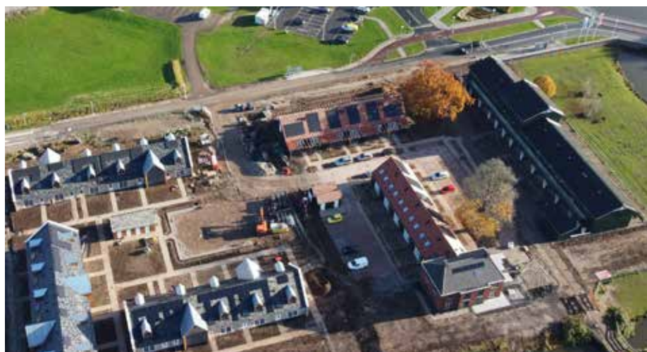
De kastanjeboom (onderaan) in buurtschap Kastanjetuin herinnert aan het huwelijk van de bewoners van de voormalige boerderij

Meer weten? Kijk op zwolle.nl/bijzondere-bomen en zwolle.nl/groene-kaart .