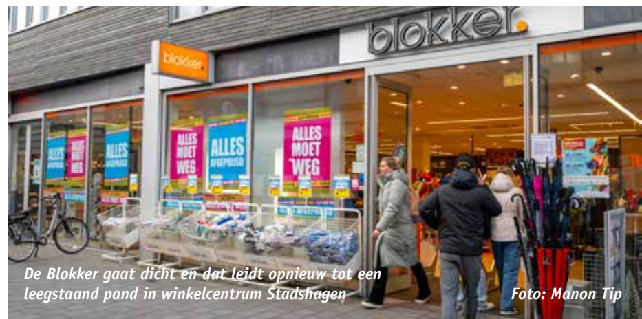
De Blokker gaat dicht en dat leidt opnieuw tot een leegstaand pand in winkelcentrum Stadshagen