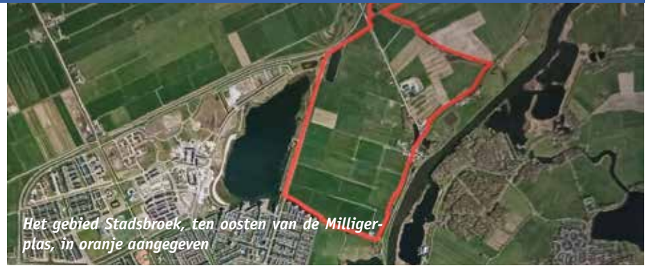
Het gebied Stadsbroek, ten oosten van de Milligerplas, in oranje aangegeven

Met de voltooiing van de uiteindelijke route van het Rondje Milligerplas komt er ook een einde aan veel overlast, omleidingen en ongenoegen voor de Stadshagenaren. Het pad was veelvuldig afgesloten, de bewegwijzering was nogal eens onduidelijk en wandelaars moesten soms hun eigen route kiezen. Na de zomer van volgend jaar zul je daar vast niemand meer over horen. Dan ligt er een aantrekkelijk wandelpad langs het water met afwisselend rust en recreatieve activiteiten. De zwaluwen in de beide zwaluwwanden in het noordelijke natuurlijke deel van de plas hebben zich dan hopelijk voluit overgegeven aan hun nesteldrang.