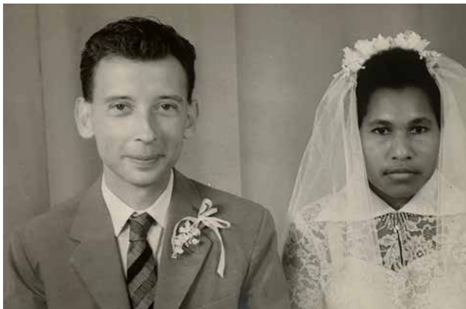
De ouders van Aliene

Hij nam afscheid en nodigde haar uit om samen weg te gaan, zonder enige romantische bedoelingen trouwens. Daarna is er vanuit Rome een grote operatie gestart om die gevluchte, ontrouwe pater tot inkeer te brengen. Uiteindelijk zijn ze weer tevoorschijn gekomen, maar waren persona non grata voor vrijwel iedereen.'