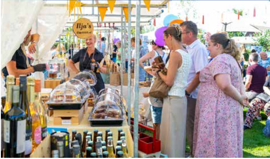
Vrijwilligers Brecamp bruist 2024