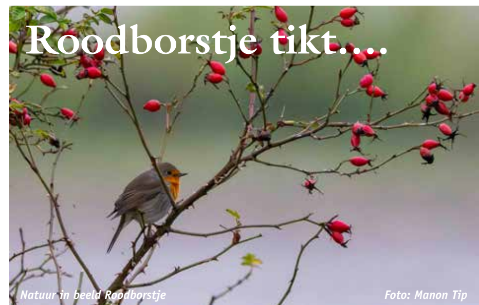
Natuur in beeld Roodborstje

buurten scoren op of dicht bij het gemiddelde van Stadshagen als totaal.