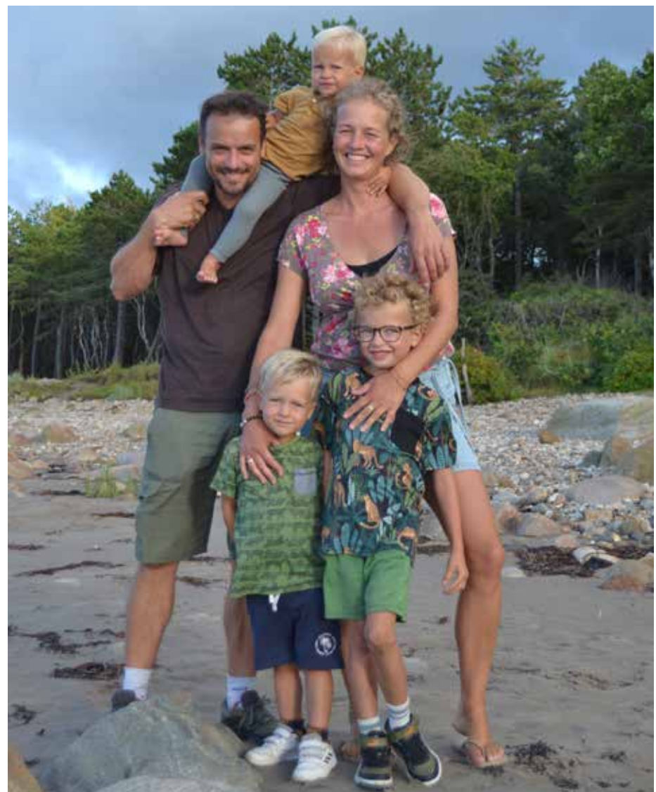
De familie de Jong-Afman op zonnig zuidelijk strand

Soms wordt ook nog iedereen tegelijk ziek... En dan is de camper te klein. Op zo'n moment willen we alle kots gewoon door de plee kunnen spoelen in plaats van er mee naar buiten te sluisen en er met een speelgoedschepje zand overheen te scheppen als het stiekem in het bos is gegooid. Dan is het allemaal net wat kleiner, ranziger en onpraktischer dan we ons hadden voorgesteld. Maar ook dat is onderdeel van het reizen, zij het de iets minder romantische kant.