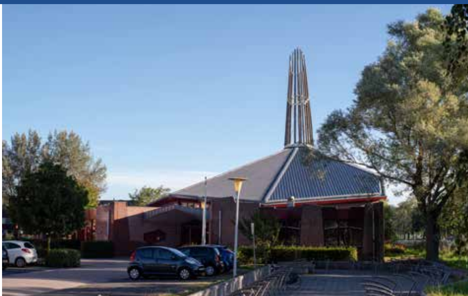
Kleding- en speelgoedbeurs in de Fonteinkerk

Je kent het vast wel. Een stoel vol gedragen kleding, uitpuilende kasten, rondslingerend speelgoed en een vloer of trap die je niet meer ziet van alles wat er op ligt. Voor veel mensen is verzamelen makkelijker dan spullen wegdoen. Afscheid nemen is lastig. Maar als je alles houdt