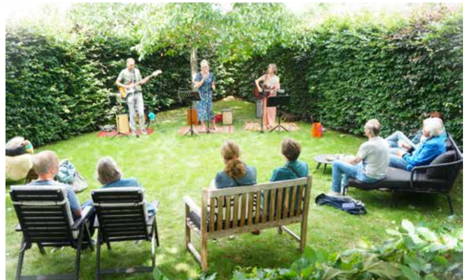
School's Out! is een nog jonge band bestaande uit drie docenten van het Thorbecke College uit Zwolle. Zij traden op aan de Belvédèrelaan.