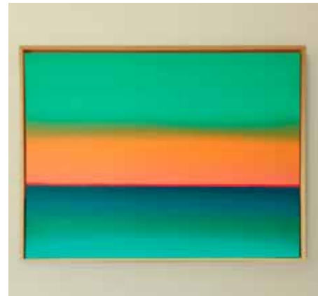
'Times like these' 50 x 60 cm, acryl

Schilderen doet zij altijd thuis, boven in haar eigen atelier. Met de spetters op de muren en verfvlekken in het vloerkleed, maar dat mag allemaal in deze ruimte waar zij zich dan ook helemaal thuis voelt. 'Als ik eenmaal aan een schilderij begin, verlies in me er soms letterlijk in en kan ik uren doorwerken. Ook kom ik helemaal tot rust, het werkt als een soort mindfulness. Inspiratie haal ik uit mooie avondluchten, een warme zomerse dag of bijvoorbeeld bepaalde gevoelens of herinneringen. Maar ook een bepaald stuk muziek kan inspirerend werken. Heel op-