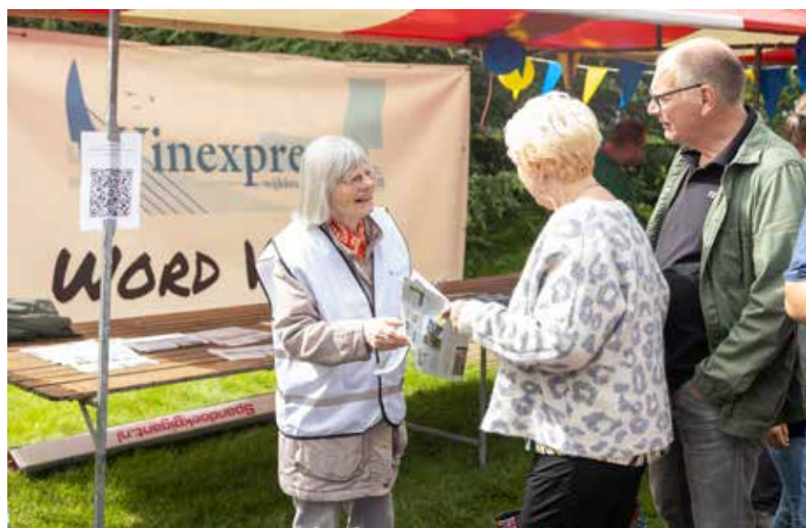
De Vinexpress werft Vrienden tijdens Stadshagenfestival

deze locatie vast. Alleen lokale partij Swollwacht pleitte voor een bebouwingshoogte die niet boven de omringende bebouwing uitkomt.