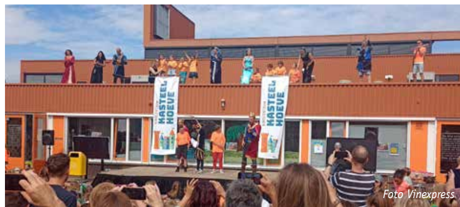
Leerlingen van De Vlieger helpen mee met de onthulling van de nieuwe naam van hun school

ger 1 al verder onder de naam WestWijs. De scholen, die allemaal onderdeel zijn van Catent, krijgen hiermee de ruimte om zich op hun eigen manier te profileren. Het zijn vier zelfstandige scholen en dat is de belangrijkste reden dat er voor nieuwe namen is gekozen.