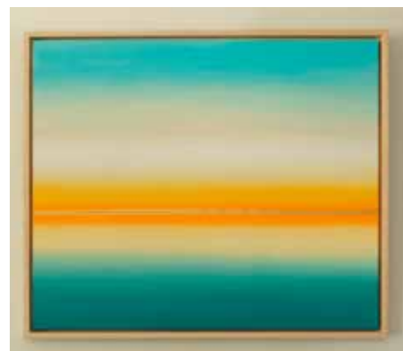
'Summer daze' 50 x 60 cm, acryl