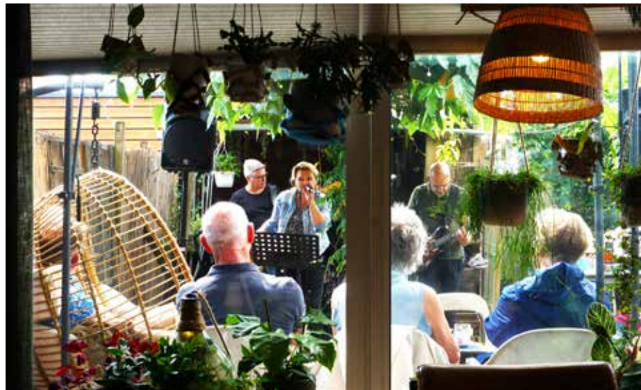
Riverside Junction is te gast in de tuin van Frankhuizerallee 118, waarbij de buurman het motto van de dag wel erg letterlijk neemt...

tuintoneel. Op deze pagina een fotoimpressie van een aantal podia in de wijk.