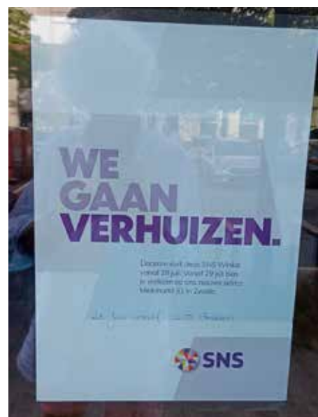
Klanten van de SNS-bank moeten nu naar de binnenstad