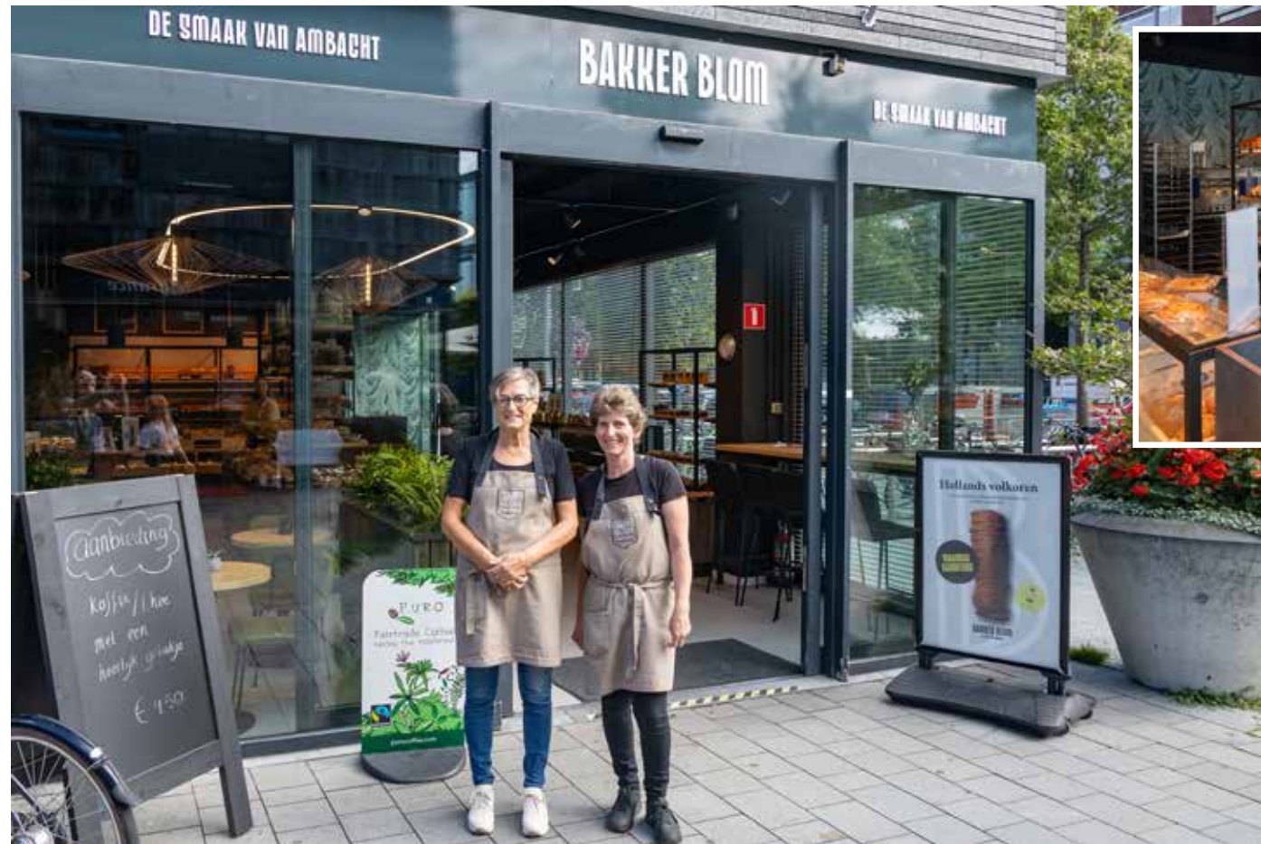
Het personeel van Bakker Blom prijst de smaak van ambacht aan