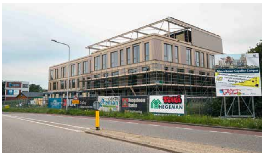
De nieuwbouw van de Van der Capellen Scholengemeenschap is bijna gereed

Meerdere raadsleden braken bij de bespreking van het Voorzieningenplan Stadshagen weer een lans voor deze optie. Wethouder Schuttenbeld tekende hierbij aan dat de gemeente niet gaat over de vestiging van scholen voor voortgezet onderwijs. ‘Daar komt bij dat de schoolbesturen in Zwolle daar zelf ook niet uit