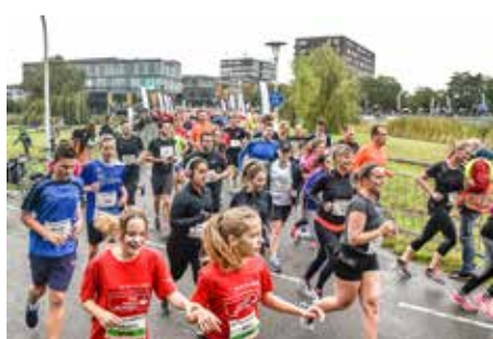
Enthousiaste start van de laatstgehouden Stadshagenrun in 2019

Deelnemers kunnen zich nog tot en met 13 oktober 2023 via www.inschrijven.nl aanmelden.