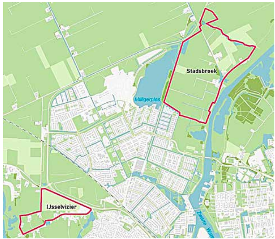
Grootschalige woningbouw en Stadsbroek en IJsselvizier van de baan

In het verleden waren er plannen om in Stadsbroek 4000 woningen te bouwen. In de afgelopen jaren kwam er steeds meer weerstand tegen grootschalige woningbouw in dit gebied. In een raadsvergadering van voor de zomer spraken alle partijen zich duidelijk uit tegen een groot woongebied. Met de richtinggevend uitspraken van het college is dit plan dan ook definitief van de baan. Wel blijft het idee overeind dat in Stadsbroek 'een nader te bepalen aantal woningen ontwikkeld kan worden, waarbij invulling