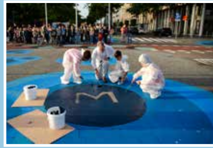
05 Proef met asfaltkunst