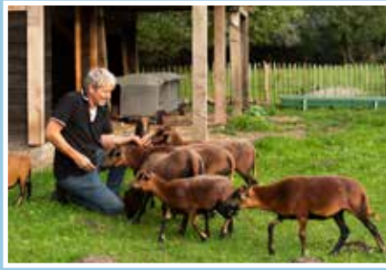
04 Voorzitter Kakel&Co zwaait af