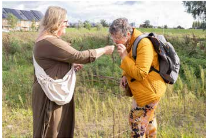
Kruidenwandeling, activiteit van SDG