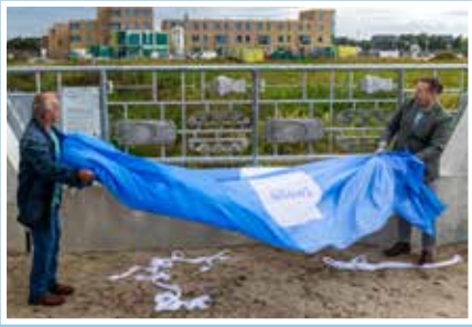
02 Monument Tankgracht onthult