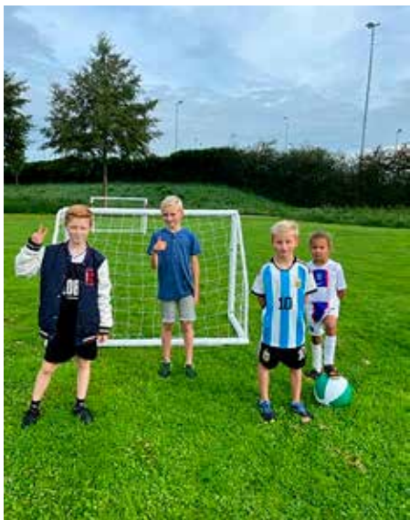
Er kan weer naar hartenlust gevoetbald worden