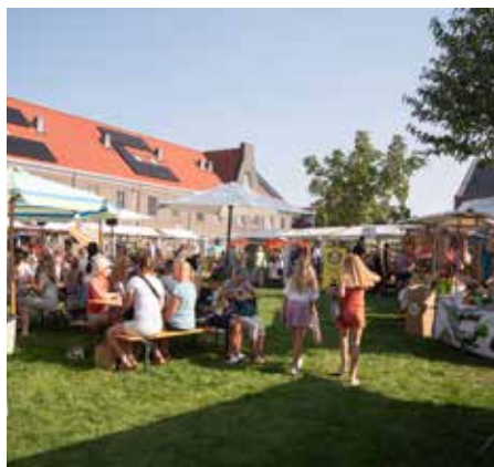
Een van de meest succesvolle burgerinitiatieven van Zwolle.

www.hofvanbreecamp.nl, of volg streek/foodmarkt breecamp bruist op facebook.