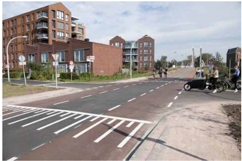
Het kruispunt Twistvlietweg-Hasselterdijk is overzichtelijker gemaakt

De werkzaamheden konden pas recent worden uitgevoerd: het wachten was op de bouw van de laatste van de zes waterwoningen aan het Zwarte Water. Het geduld van de Hasselterdijkers is al geruime tijd op de proef gesteld. De rommelige en hobbelige dijk was hen een doorn in het oog. Voeg daar nog bij de overlast van automobilisten die zich van geen kwaad bewust in de fuik van het Twistvlietpad lieten rijden. De confrontatie met het onvriendelijk bord met de tekst 'Fietsers welkom, auto's niet' bracht menig bezoeker en ook fietsers in vertwijfeling. Nu zijn de eerste signalen vanuit de buurt dat van rondlopende automobilisten nog weinig sprake meer is.