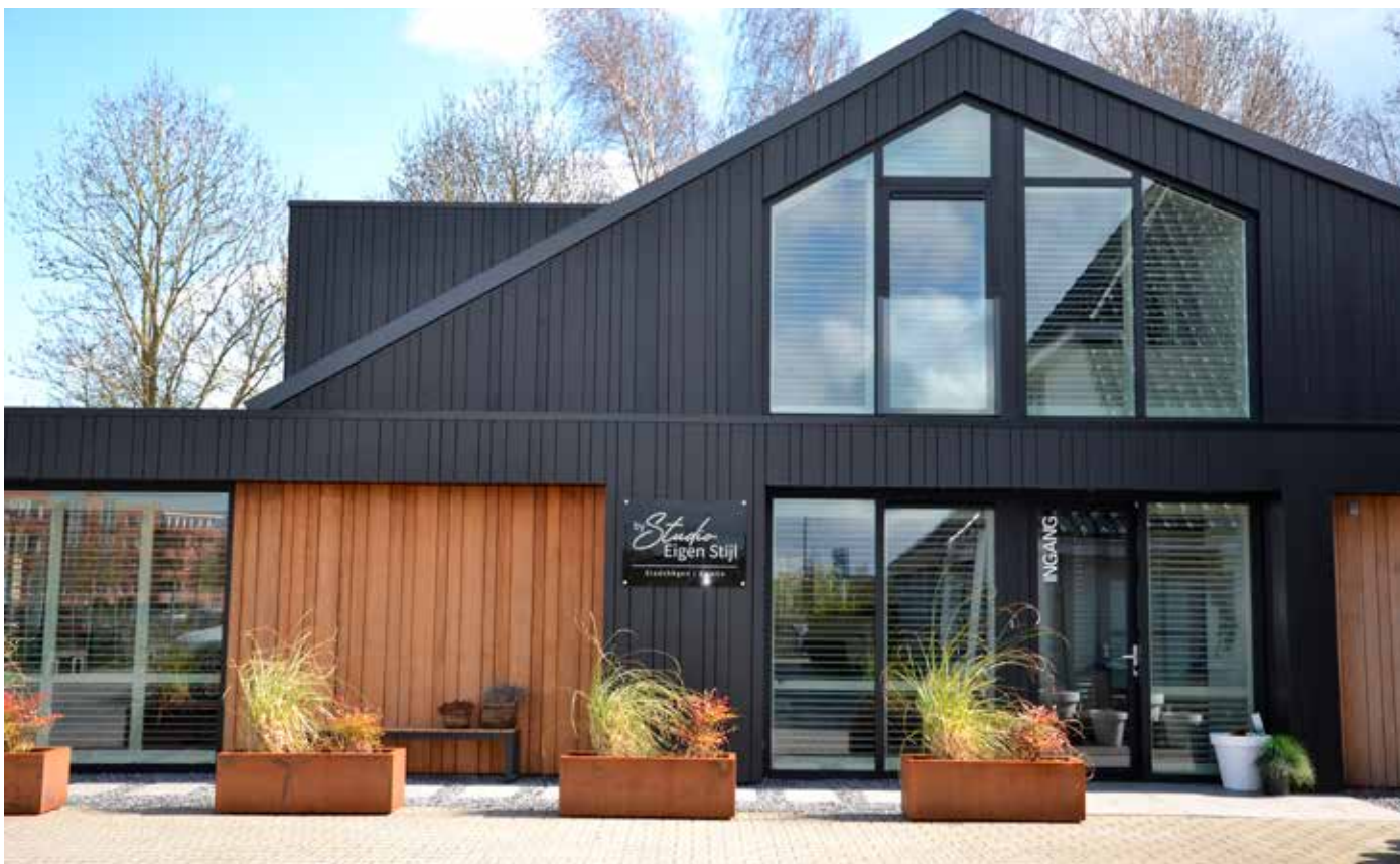
Werkfuncties en ontspanning vormen in de studio van EigenStijl een aantrekkelijke combi

Voor meer informatie: www.studioeigenstijl.nl