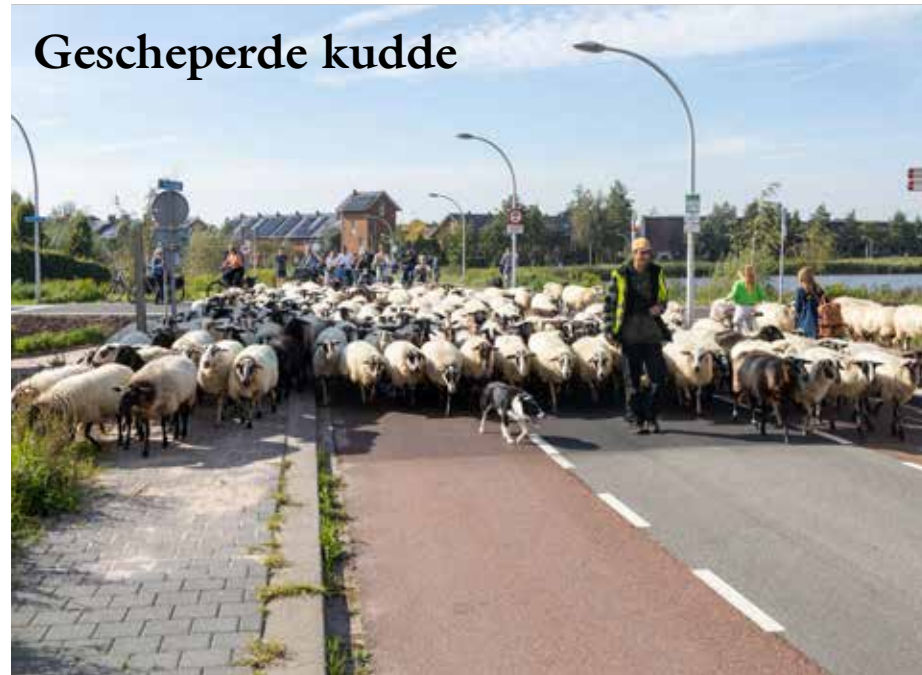
Zwolse schaapskudde op weg naar vers gras in Stadshagen