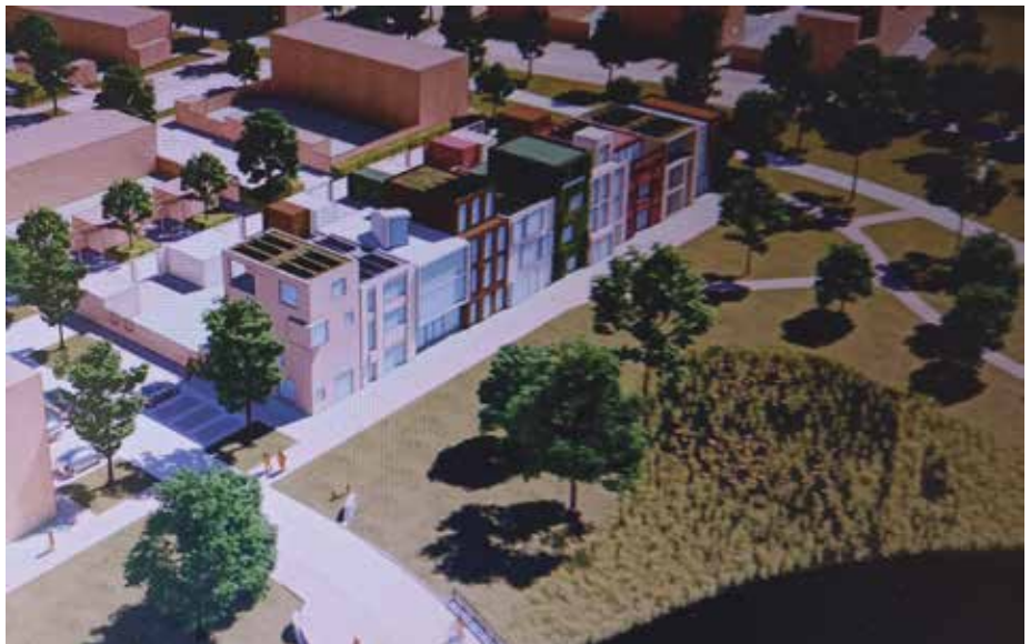
Illustratie gem. Zwolle

Nu de plannen voor buurt Breezicht zo langzamerhand zijn uitgekristalliseerd, richten de ogen van de bouwers en ontwerpers zich op de nieuwe buurt De Tippe. Het gebied ligt tussen de spoorbaan naar Kampen en de Hasselterweg, aan de zuidwestzijde van Stadshagen. Hier worden de komende jaren ongeveer 1300 woningen gebouwd. Elders in deze krant besteden wij aandacht aan de initiatieven in De Tippe die in de vorm van co-creatie worden opgezet. Daarnaast worden momenteel ook andere bouwplannen gepresenteerd. In buurtschap De Stedelijke Radialen worden onder de naam Weideburen tien kavels aangeboden voor onder architectuur te bouwen geschakelde woningen. Daarnaast worden tien rijwoningen gerealiseerd, grenzend aan het toekomstige buurtpark het Weidepark.