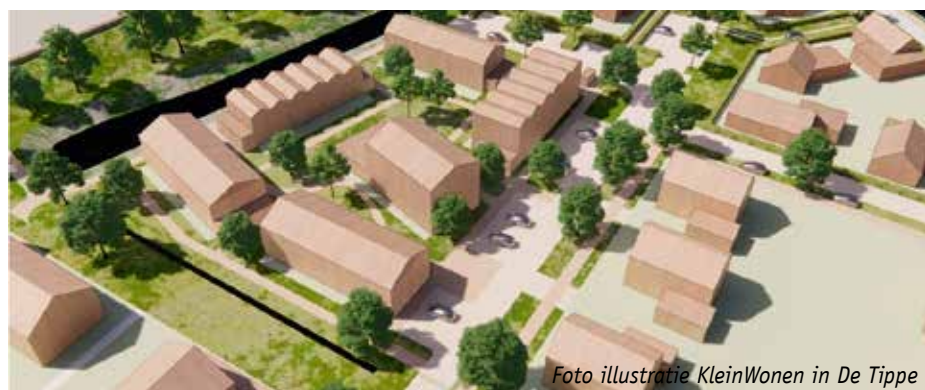
Foto illustratie KleinWonen in De Tippe

Het eerste schetsontwerp van de 36 kleinere woningen in De Tippe