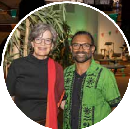
Tijdens de avond trad de band Tribute&Benefits op met vooral Top2000 muziek