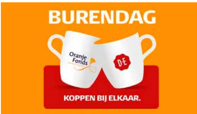
Tijdens Burendag werden in Park de Stadshoeve workshops gehouden