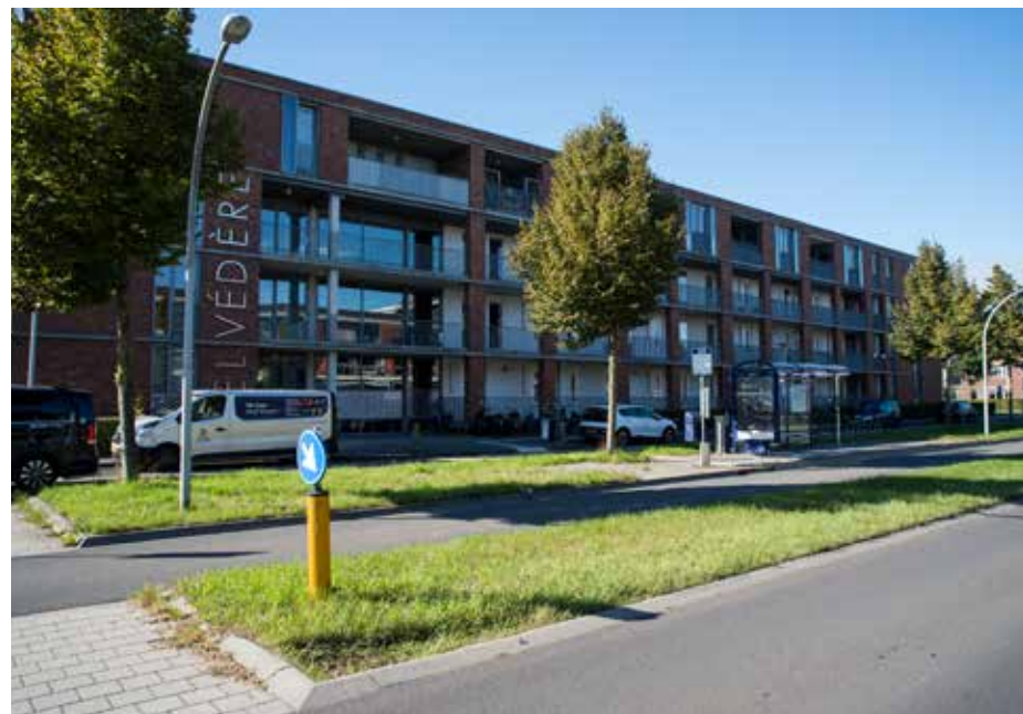
Het Fokus-project op de hoek Frankhuizerallee en Belvédèrelaan

Nadere informatie kan gevonden worden op www.werkenbijfokus.nl .