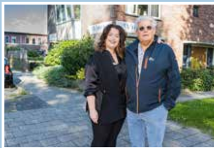
14 Kapper Bijsterbosch uitgeknipt

HUIS VERKOPEN? Dé makelaar in Stadshagen