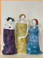
Ellen Adank Keramiek