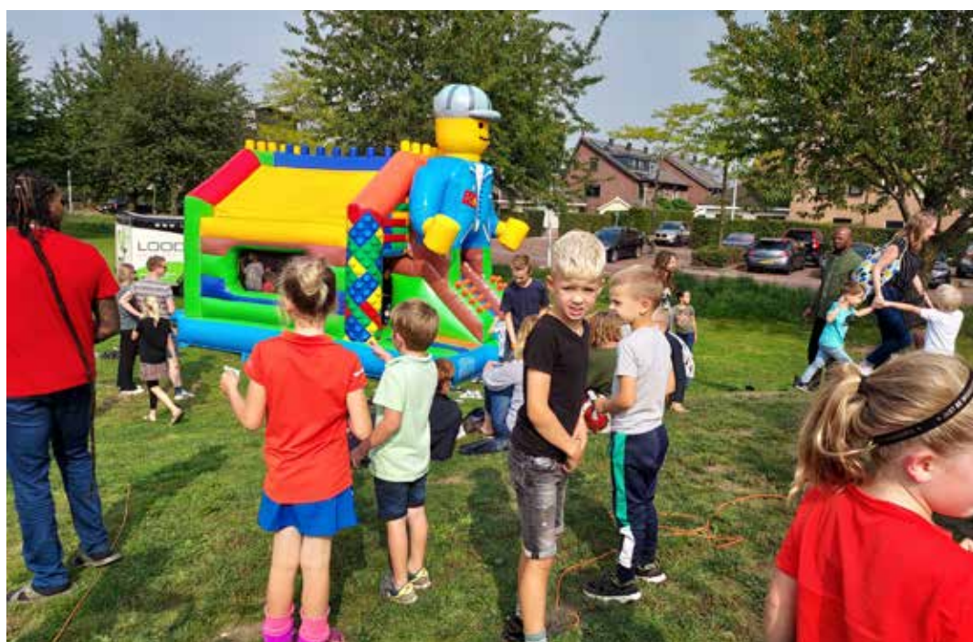
Zomerse activiteiten bij basisschool de Zevensprong

Net als het delen van foto's en herinneringen kan dit op het mailadres: 25jaarzevensprong@viventenue.nl .