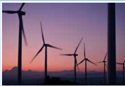
11 Windmolens in de polder?