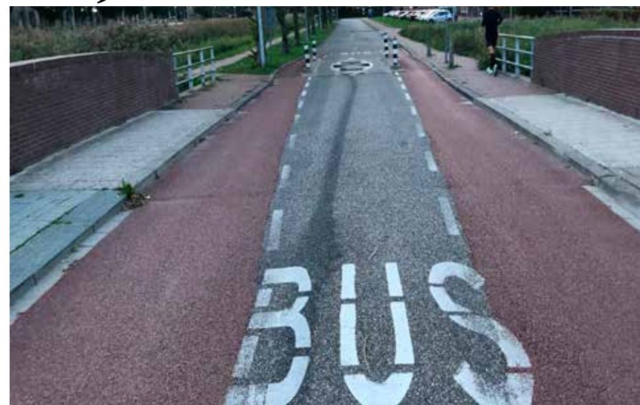
Passages bij de busluizen zijn smal en onveilig

Het tweerichtingen-fietspad in de groene long van Stadshagen is krap, terwijl er wel ruimte is. Die route is niet robuust gemaakt en geschikt voor het gezamenlijk gebruik door wandelaars, joggers, hondenuitlaters en fietsers. Dat is zonde,