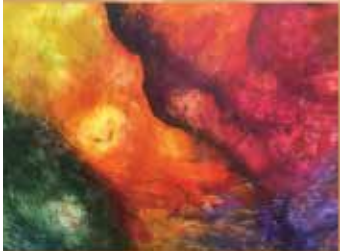
Ellen Adank Schilderijen