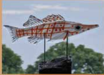
Marije Gies Magies Glas Glaskunst