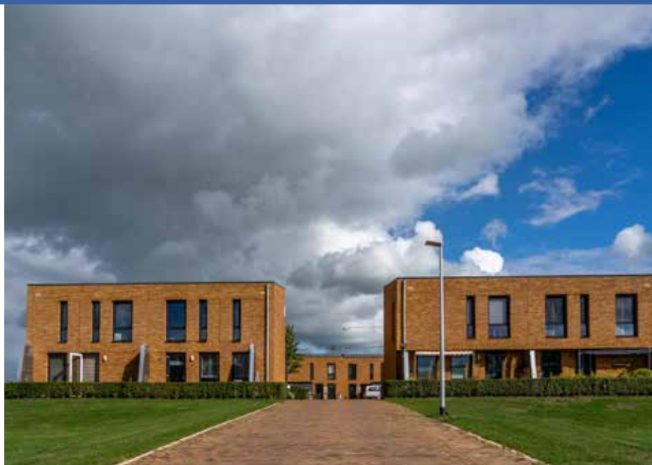
De Wenckebachstraat ligt deels op een terp