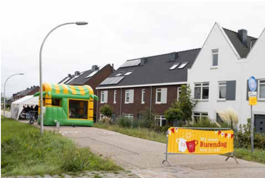
Ook de Hasselterdijk pakte uit tijdens Burendag