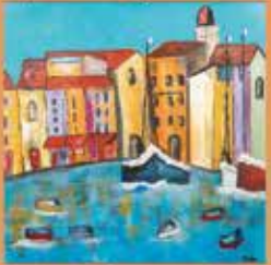
Rietje Zwanenburg RietjeArt Schilderijen Vrijheid