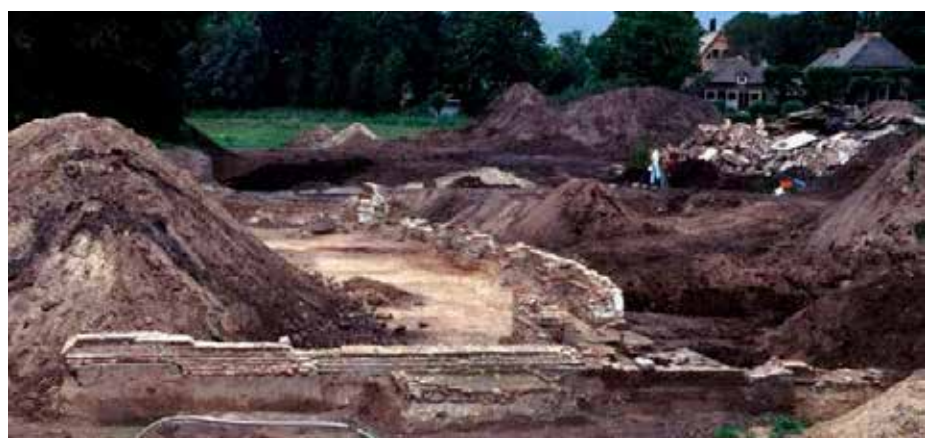
In 2001 werden de fundamenten van kasteel Werkeren blootgelegd

De plannen rond het sportpark van CSV'28 behelzen het ombouwen van het complex tot een zogeheten Urban Sportpark. Zo zou de voetbalkantine kunnen worden omgebouwd tot een buurtkantine voor de wijk, in het bijzonder voor buurt Breecamp. Daarnaast wil de club de omgeving van de kantine vergroenen en ook andere sportmogelijkheden gaan aanbieden. De motie die door verschillende fracties was ingediend om geld beschikbaar te stellen werd aangehouden. Wethouder Van Willigen (ChristenUnie) gaf aan eerst meer te willen weten over de betekenis van de plannen voor de buurt.