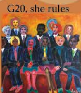
Linda de Wit Schilderijen

Cultuurhuis Stadshagen/Werkerlaan 1/8043LT Zwolle 1 oktober 2022 t/m 25 november 2022 Contactpersoon en verkoop: Gea Bosscher, venisbosscher@planet.nl