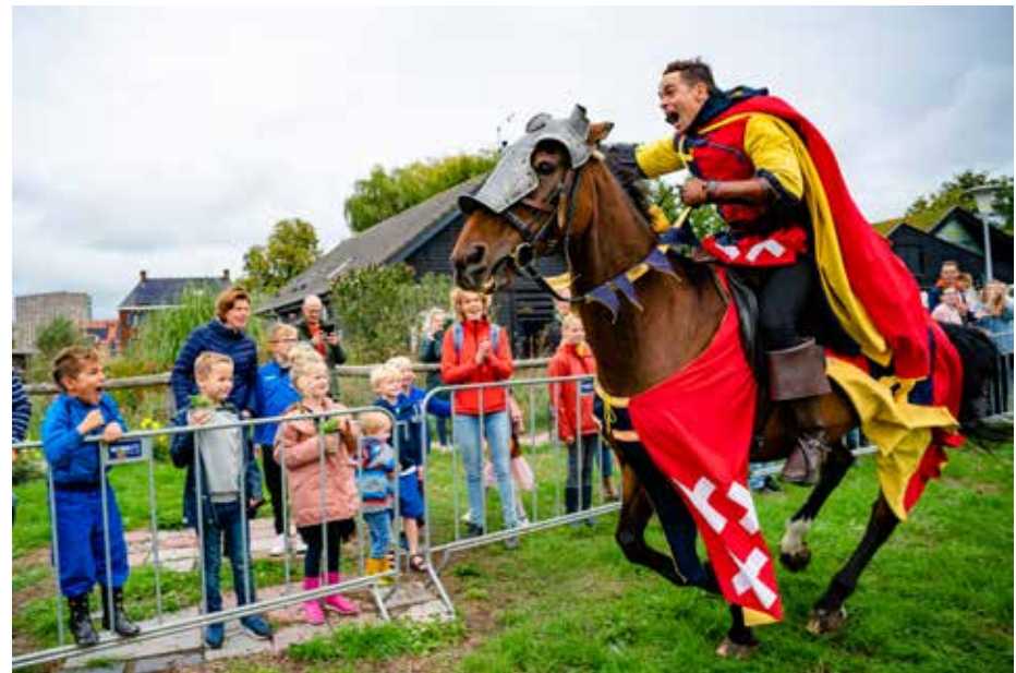
In Park de Stadshoeve werd Burendag gecombineerd met het 5-jarig jubileum van het park. Er was een spectaculaire show van ridders te paard