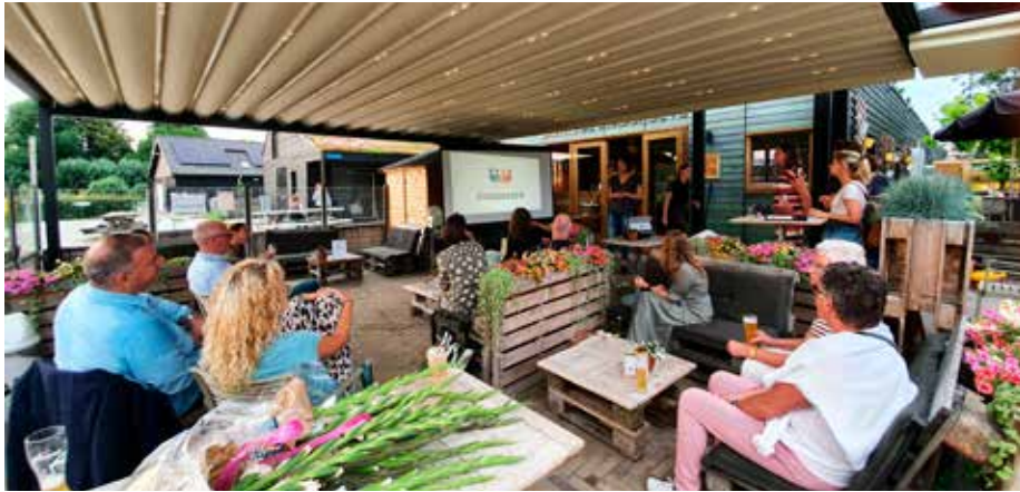
Ondernemers uit Stadshagen ontmoeten elkaar in De Stadshoeve

Als zevende les tijdens de bijeenkomst 25 jaar Stadshagen wordt ingegaan op een plek voor ZZP'ers in de wijk. Het bestuur van Ondernemers Netwerk Stadshagen (ONS) herkent deze behoefte. Stadshagen is een jonge wijk, waar veel inwoners actief zijn als ondernemer. Groot of klein(er), fulltime of als deeltijdbaas. Speciaal voor hen organiseren wij netwerkbijeenkomsten en -borrels, workshops en bedrijfsbezoeken om elkaar te ontmoeten, te verbinden en van elkaar te leren.